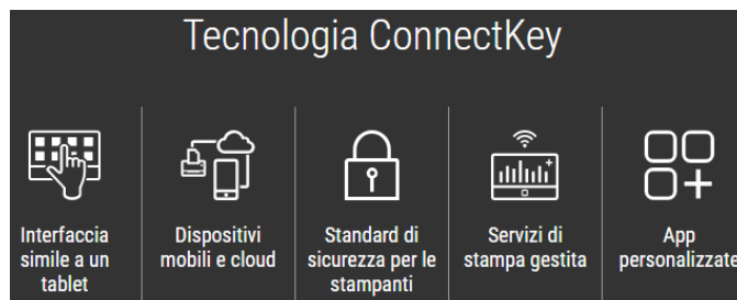
FUNZIONI DI SICUREZZA

La sicurezza è una delle nostre priorità e sappiamo che lo è anche per la tua azienda. Ecco perché ogni dispositivo con tecnologia Xerox® ConnectKey® si basa sul nostro approccio olistico in quattro punti per la sicurezza , che garantisce la protezione completa di tutti i componenti del sistema e di tutti i punti vulnerabili.